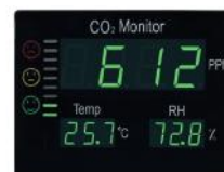
Afficheur CO 2

NatéoSanté propose une gamme complète d'appareils de mesure (CO 2 , COV...), de kits d'analyse et de purificateurs d'air professionnels pour chacun de vos espaces. Facilement transportables , tous nos purificateurs sont simples d'utilisation : aucuns travaux ne sont nécessaires, une simple prise électrique suffit.