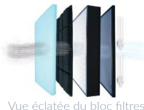
Vue éclatée du bloc filtres